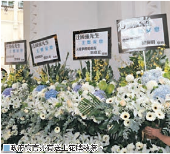
政府高官亦有送上花牌致祭。