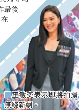
敏奕表示即將拍攝無綫新劇。