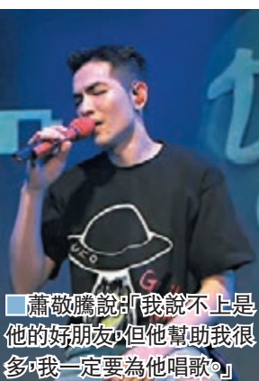
蕭敬騰說「我說不上是他的好朋友，但他幫助我很多，我一定要為他唱歌」。