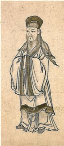
治平帖前的東坡先生像。

展覽分為四個單元。第一單元「勝事傳說誇友朋」通過蘇軾及其師友的作品，展現蘇軾的交遊圈與他所處的時代。第二單元「蘇子作詩如見畫」通過蘇軾和後世書法家所書寫的蘇軾詩文作品，以及後世畫家根據蘇軾詩文所創作的繪畫作品，展現蘇軾的文學造詣。第三單元「我書意造本無法」通過蘇軾師法的前人作品、蘇軾本人的書法創作以及後世臨仿蘇軾的作品，展現蘇軾的書法藝術及其影響。第四單元「人間有味是清歡」通