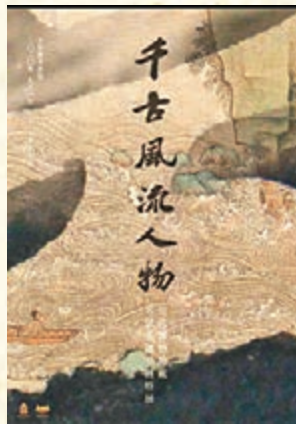
展覽海報標題「千古風流人物」是從《答謝民師論文》《姑孰帖》《前赤壁賦》中集字而來，均為蘇軾本人所書。