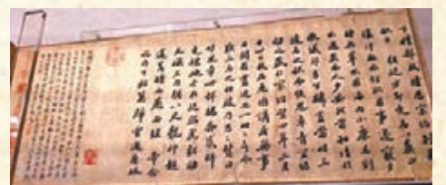
蘇軾《三馬圖贊並引殘卷》

是為李公麟《三馬圖》所作的跋贊，繪畫、書法本為一卷，屬清宮舊藏，後流散出宮被人撕毀，僅存殘卷兩段藏於故宮博物院，鮮為世人知曉。故宮博物院研究室副研究員段瑩表示，作這個贊時，蘇軾年62歲，贊以行楷書寫成，筆勢蒼勁渾厚。