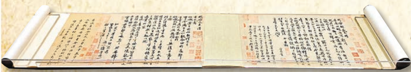
蘇軾《新歲展慶帖》、《人來得書帖》合卷