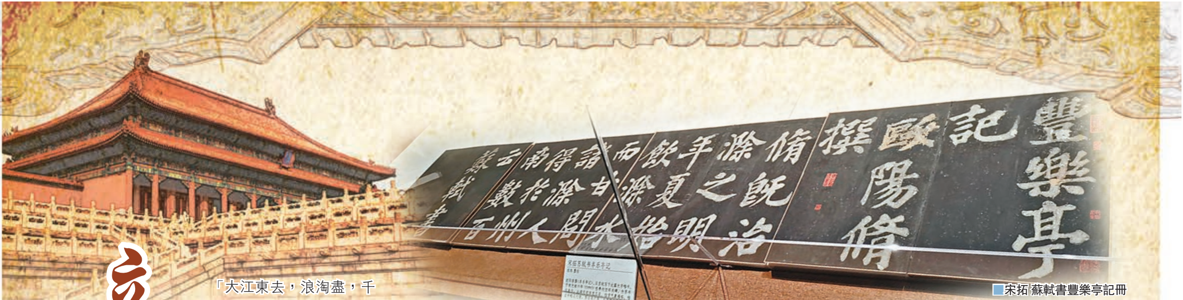
宋拓蘇軾書豐樂亭記