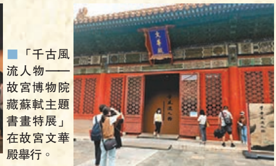
「千古風流人物——故宮博物院藏蘇軾主題書畫特展」在故宮文華殿舉行。