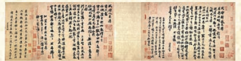
蘇軾《新歲展慶帖、人來得書帖合卷》

《新歲展慶帖、人來得書帖合卷》則是蘇軾寫給好友陳慥的兩封書札，據考證均寫於元豐四、五年間（1081-1082年）。如果看過古天樂、張柏芝演的電影《河東獅吼》，那就一定知道懼內的陳季常。陳慥字季常，晚年隱居黃州（今湖北黃岡），兩人相識於蘇軾陝西鳳翔任上，後在黃州相遇，遂成知己。這「怕老婆」的名頭，就是被「損友」蘇東坡冠上的。《新歲展慶帖》除了向友人說明近況外，還約陳慥與李常（字公擇）於上元節時在黃州相會，反映了蘇軾與朋友之間的交往。《人來得書帖》是為陳慥的哥哥伯誠之死而慰問陳慥所作。展覽策展人、故宮博物院書畫部館員郁文韜表示，二帖筆意自然生動，情致俱佳，為蘇軾這一時期的代表作之一。