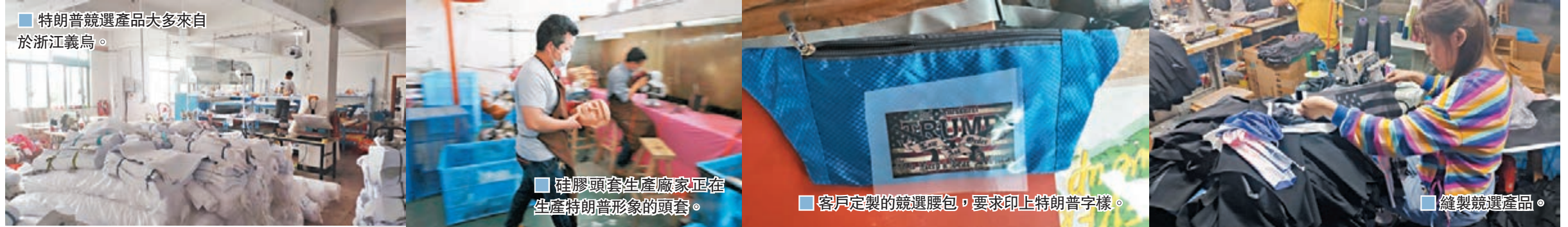
■ 特朗普競選產品大多來自於浙江義烏。