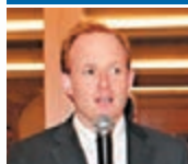
太古股份主席施銘倫

相信國家安全法的制定，將有利香港作為世界級商業及金融中心的長遠發展。香港作為中國的一個特別行政區，需要健全的法律框架以維護國家安全，這是「一國兩制」的必要元素。