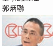
新地主席兼董事總經理郭炳聯

自香港國安法實施後，香港社會逐漸恢復穩定，進一步締造安定有序的投资、營商和社會環境，保障廣大市民利益，鞏固香港國際金融中心地位。