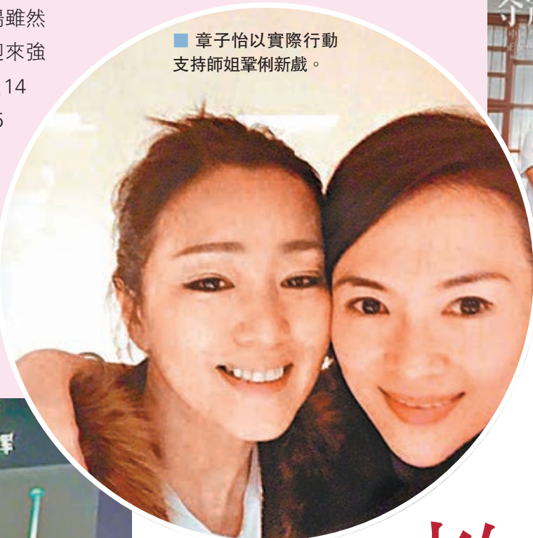
■ 章子怡以實際行動支持捧場新戲。

香港文匯報訊（記者李思穎）中國電影市場雖然一度因疫情影響而停擺，但在今年國慶期間迎來強勁復甦。電影《我和我的家鄉》昨日已經突破14億，領跑2020國慶檔票房，《奪冠》亦破5億，成績不俗。事實上，不少藝人都趁空檔入戲院睇戲，以實際行動支持電影業，對中國復甦貢獻一分力量，除汪明荃與老公羅家英拍拖睇《奪冠》外，章子怡也帶同女兒入戲院捧場，順道從電影中教女兒學懂不要因為坎坷而止步，別因挫折而放棄，記下這些人生道理。