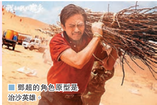
■ 鄧超的角色原型是治沙英雄。