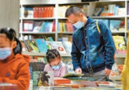
家長帶孩子選購圖書。