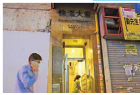
灣仔謝斐道快活大廈