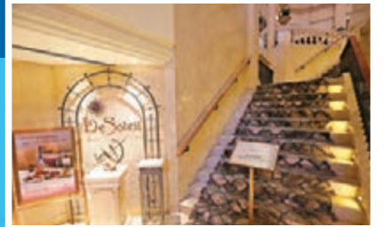
尖沙咀帝苑酒店3樓Le Soleil越南餐廳