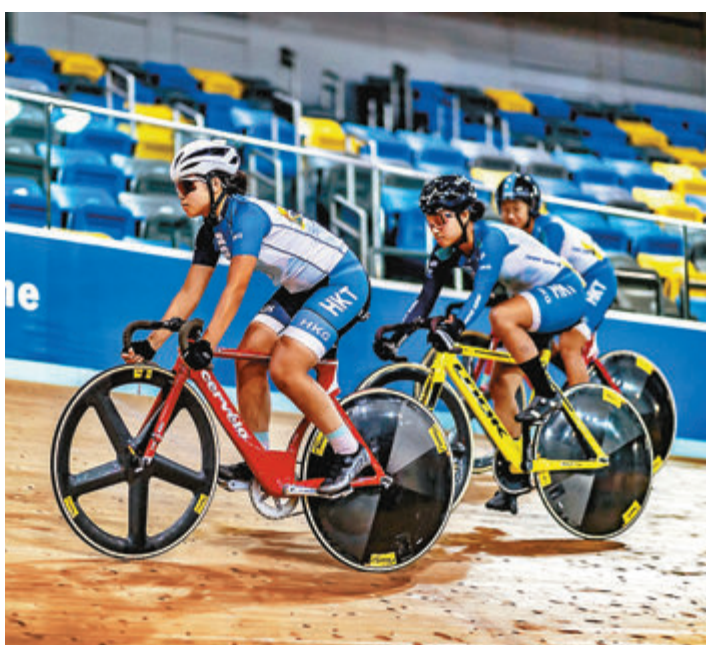
香港單車隊上月底在將軍澳香港單車館進行測試賽。資料圖片

香港文匯報訊(記者陳曉莉)受新冠病毒的疫情所影響,國際單車總會(UCI)世界性賽事需於2021年才正式展開。根據UCI新訂定的世界性賽事3站UCI Nations Cup(國家盃)及世界場地單車錦標賽,香港將於明年5月13至15日主辦第2站國家盃賽事,屆時,香港單車代表隊將再次主場出戰為港爭光。