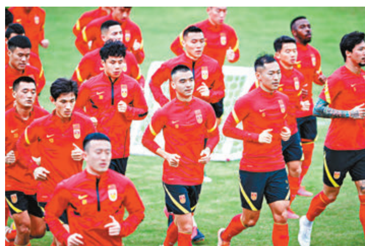
中國國家男子足球隊在上海集訓。