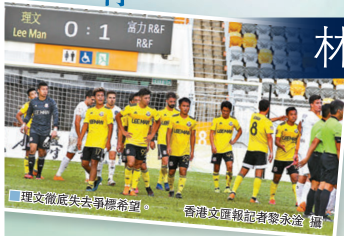
理文徹底失去爭標希望。

香港文匯報訊(記者黎永淦)富力R&F昨日憑林樂勤上半場一錘定音,以1:0小勝理文,聯賽爭標一息尚存,惟仍要期望偷園在最後一輪打敗傑志。主教練楊正光賽後坦言,假若最終失落聯賽冠軍,最大原因是受到疫情拖累。