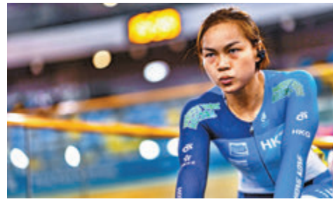
李慧詩明年5月將主場迎戰世界強手。

UCI國家盃除可為市民帶來高水平的場地單車賽事外,亦使香港單車代表隊再次在主場出戰,為港爭光。屆時,希望更多市民可入場觀賞賽事及為港隊打氣加油。