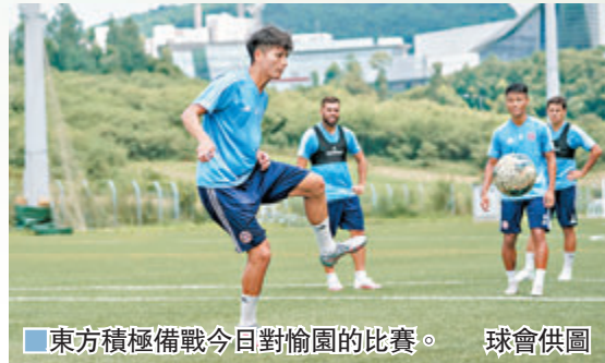
東方積極備戰今日對偷園的比賽。球會供圖