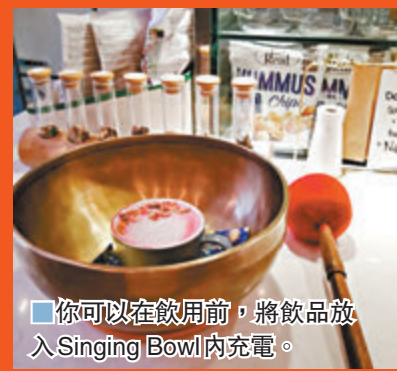
你可以在飲用前，將飲品放入 Singing Bowl 內充電。

Cafe 店融入「Singing Bowl」飲食學，這是一種玩法，能把正能量輸送到飲品內，食客可隨意體驗。他們建議你在飲用前用唱歌碗給水、咖啡和茶充電，因萬物皆有能量，沒有生命的物件其實亦有量子磁場。其做法有序，先嚐飲品原味，然後把它放進頌鉢中心，專注聯想自己的心事心願，一邊以鎚仔敲「Singing Bowl」，一邊以手感受振動，然後取出飲品再品嚐，或許有不一樣的感受與味道。