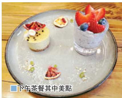
下午茶餐其中美點

從餐牌上看到，Food in a Jar 包羅了冷熱食選擇，多款沙律選擇，並設有柑橘醬冷麵，而熱盤則有椰汁咖喱海鮮、慢燉韓式雞肉、蒸紅鯛魚配柑橘醬、慢煮牛腩配雜菜等，並可選藜麥小米或雜糧，而甜品如 72% 朱古力意式芝士蛋糕、希臘式乳酪芝士蛋糕等，全放在玻璃瓶中。除了樽仔美食外，這兒亦設有多款套餐，如 Vibes 早晨全餐純素版。另外，如想跟朋友一聚交心，並品嚐甜點與咖啡，可選這個 Vibes the High-Tea Set ($98)，包羅了多款甜點選擇，如 Passion Fruit、Mixed Berries、Chocolate、Lychee Rose 及 Marcha 等，從中可選一款蛋糕及一款布丁，以及一杯 $45 飲品，清新與濃郁兼備。這兒另一特點是店內有幾個不同顏色大小的「Singing Bowl」，食客可以要求將飲品放在其中，邊敲邊禱告，透過聲音與振動可以淨化飲品，並淨化心靈，食客敲擊力度不同，便會有不同聲音出來，表示食客當刻的心情是如何，更了解自己。