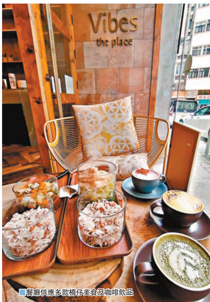
餐廳供應多款樽仔美食及咖啡飲品