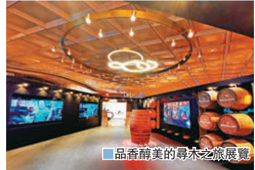
品香醇美的尋木之旅展覽

為慶祝開幕，品牌首次在亞太區推出兩款全新佳釀：The Macallan Double Cask 15 年及 The Macallan Double Cask 18 年，亦由即日起至 10 月 10 日特別舉行「The Macallan Double Cask 品香醇美的尋木之旅展覽」，在攝影師 Steve McCurry 的帶領下，探索以美國與歐洲雪莉橡木桶釀製而成的 Double Cask 的故事。