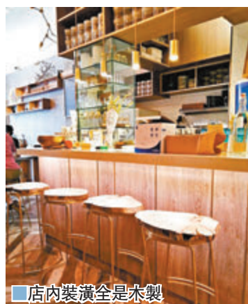
店內裝潢全是木製