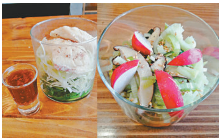
美食採用玻璃瓶盛載，讓食客一目了然。