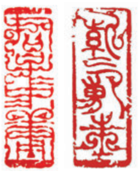
鳥蟲篆印《君子中庸》（左圖）和《紫氣東來》（右圖）。