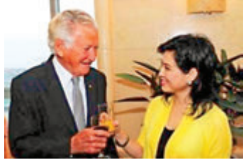
澳洲前總理霍克（左）與陳復生（右）互祝酒道賀「亞太地區的安全與合作」國際學術研討會圓滿成功。