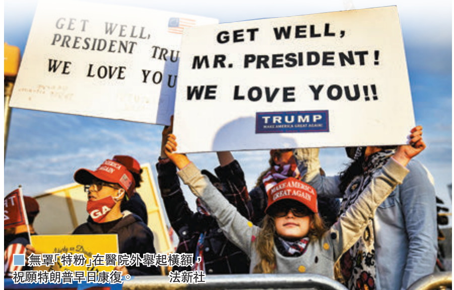
■ 無罩「特粉」在醫院外舉起橫額，祝願特朗普早日康復。

特朗普身邊小圈子封鎖疫情消息的做法，令白宮西翼人人自危。據報特朗普競選經理施特平直到上週四晚，才透過媒體得知希克斯確診。曾與希克斯密切接觸的白宮發言人麥肯納尼，更是在週四下午突然被通知不能隨特朗普前往新澤西州，她本人直到當晚才得知希克斯確診。 ■綜合報道