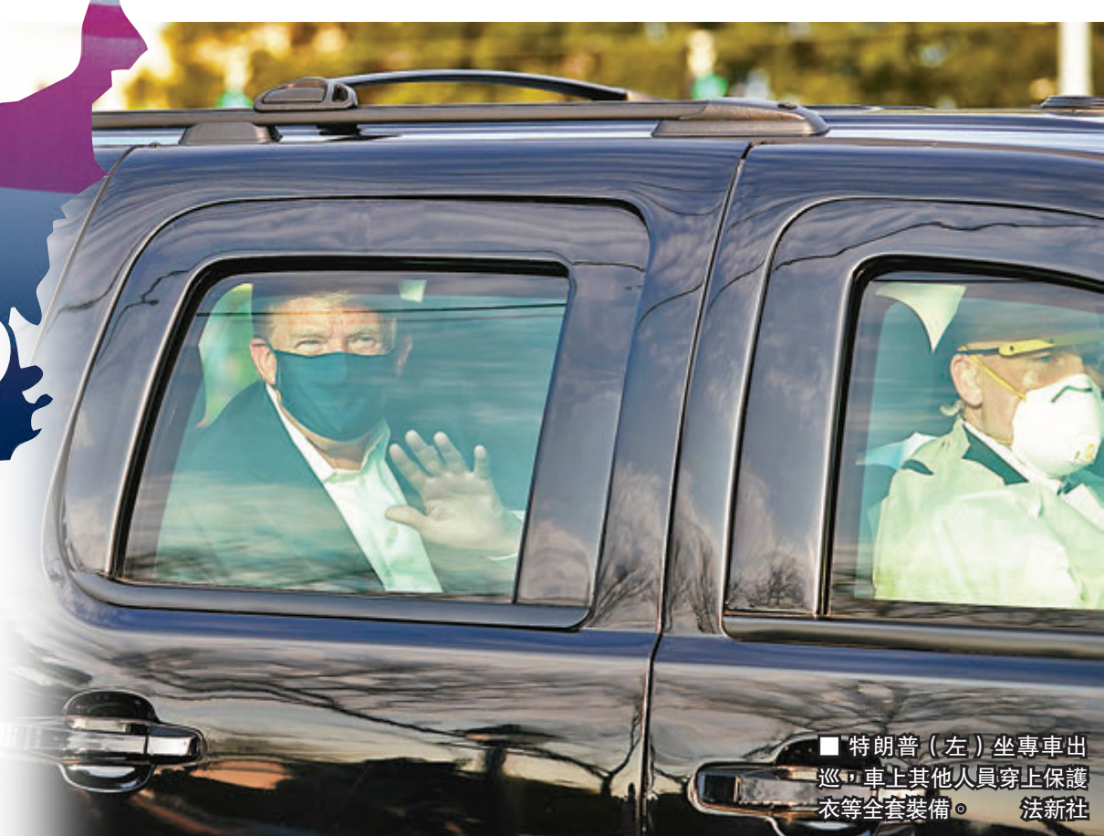
■ 特朗普(左)坐專車出巡，車上其他人員穿上保護衣等全套裝備。