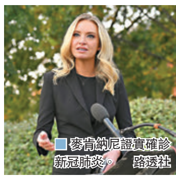
■ 麥肯納尼證實確診新冠肺炎。

示白宮醫療團隊認為記者不算是密切接觸者。麥肯納尼在發給傳媒的聲明中，特別提到自己在上周四晚召開白宮記者會前，根本不知道希克斯確診，似是要為自己當日早上仍與記者接觸辯護，並對特朗普親信隱瞞希克斯確診表示不滿。 ■綜合報道