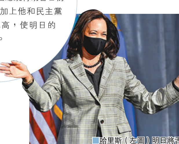
■哈里斯(左圖)明日將舌戰彭斯(右圖)。