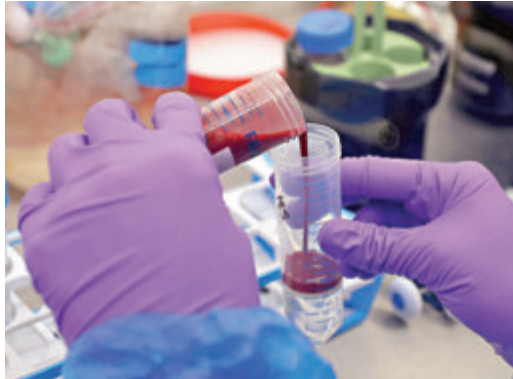
■研究員化驗新冠患者的血液樣本。

據《每日電訊報》報道，確診病例因電腦系統「停運」而漏報，意味追蹤確診人士密切接觸者