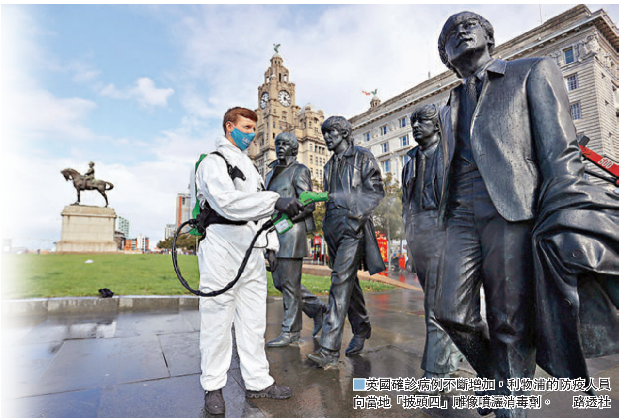
■英國確診病例不斷增加，利物浦的防疫人員向當地「披頭四」雕像噴灑消毒劑。