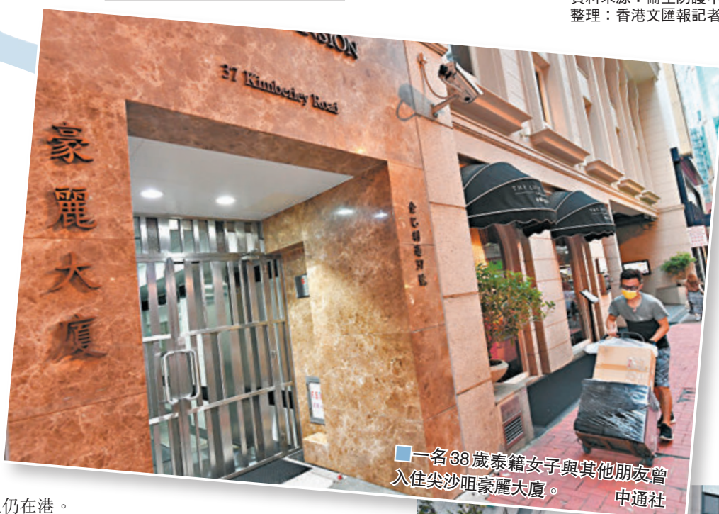
一名38歲泰籍女子與其他朋友曾入住尖沙咀麗豪大廈。