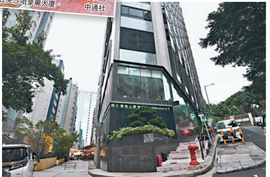
圖為確診泰籍女子曾入住的仕德福山景酒店。

另外兩宗本地有關聯個案，分別是55歲男子和31歲女子（個案5124、5125），為前日確診的73歲尼泊爾來港老婦（個案5110）的同住親戚，二人在醫院檢測呈陽性，有病徵。