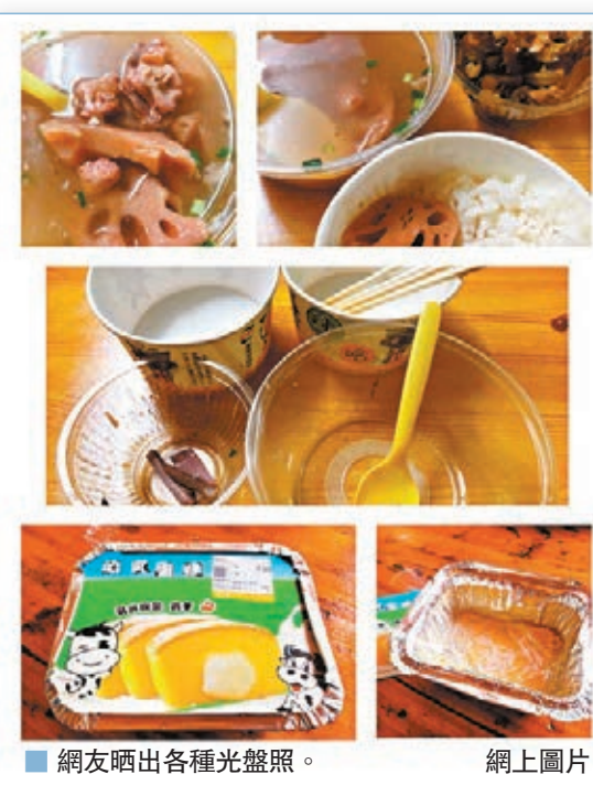
網友晒出各種光盤照。

冠肺炎疫情、長江流域嚴重的洪澇災害，更顯糧食豐收的來之不易。在習近平總書記對制止餐飲浪費行爲作出重要指示以來，無底線的浪費吃播受到民眾的抵制，社會各界紛紛響應，提倡節約，出妙招，積極制止餐飲浪費。「光盤行動」，永遠沒有休止符。