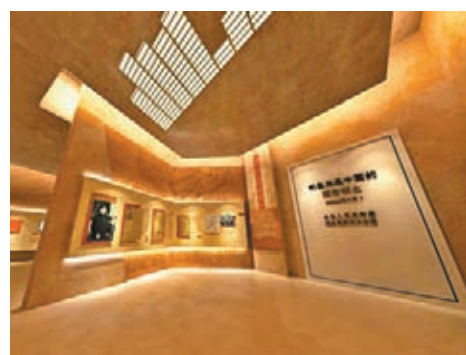
博物館生動地展示了釣魚島主權屬於中國的法律和歷史依據。

中國釣魚島數字博物館由福建師範大學釣魚島研究團隊設計創建，目前先行開通了中文版，之後還將適時開通英、日、法等其他語種版本。