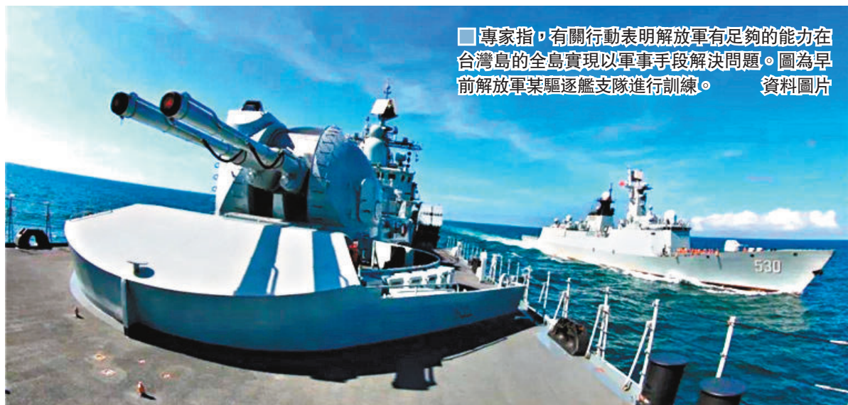
專家指，有關行動表明解放軍有足夠的能力在台灣島的全島實現以軍事手段解決問題。圖為早前解放軍某驅逐艦支隊進行訓練。

台媒引述台灣防務部門人士報道說，解放軍1艘軍艦10月2日凌晨出現在台灣東部的宜蘭、花蓮縣外海30海里，距離毗連區水域6海里，該艦10月3日向北航行。報道稱，解放軍軍艦9月17日也曾出現台灣東部外海，距離花蓮清水約39海里。另一方面，台灣防務部門1日表示，解放軍1架運-8反潛機10月1日進入台灣西南防空識別區（ADIZ），防務部門除了派遣空中巡邏兵力應對外，也實施廣播驅離、防空飛彈追蹤監控等作為；這是解放軍近兩週以來第九度接近台灣空域。