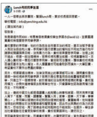
「Lunch仔」煽動一人一信幫佢向停佢課學校施壓。

10月1日一班「手足」俾人拉嘅時候，唔「和你上街」之餘，「Lunch仔」仲厚面皮向大家求助，事緣佢問學校因佢組織參與政治活動，擔心佢有墮入法網嘅風險，佢又成日着校服參與示威，令人誤以為佢代表校方立場，多番教育佢但繼續違反校規，學校於是勒令佢停課反思已過，做返中學生求學時期嘅本分。不過佢就擺明有反思，