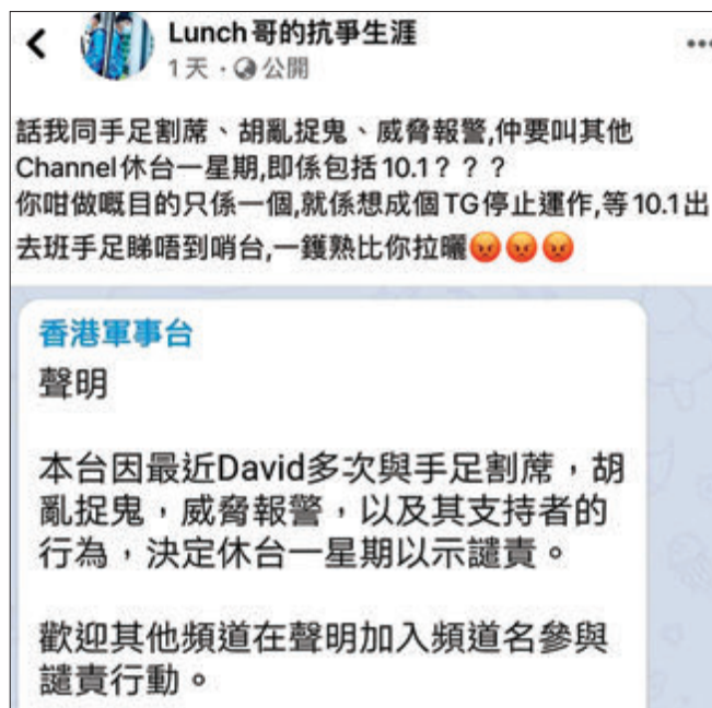
「Lunch仔」懶理譴責，反指休台會令暴徒一鑊熟。fb截圖

「Lunch仔」對「手足」一言不合就分化，搞到班「同路人」極度唔啱佢，聲言「Lunch仔」快被「手足」圍毆，而「Lunch仔」就搬出法律條文威脅，令更多「同路人」不滿，幾十個Telegram (TG) 頻道今個星期休台一周以示譴責。而「Lunch仔」就死撐，質問班人係咪要「10.1出去班『手足』睇唔到啱台，一鑊熟比（俾）你拉囉（晒）」，雙方互咬到一地狗血同花生。