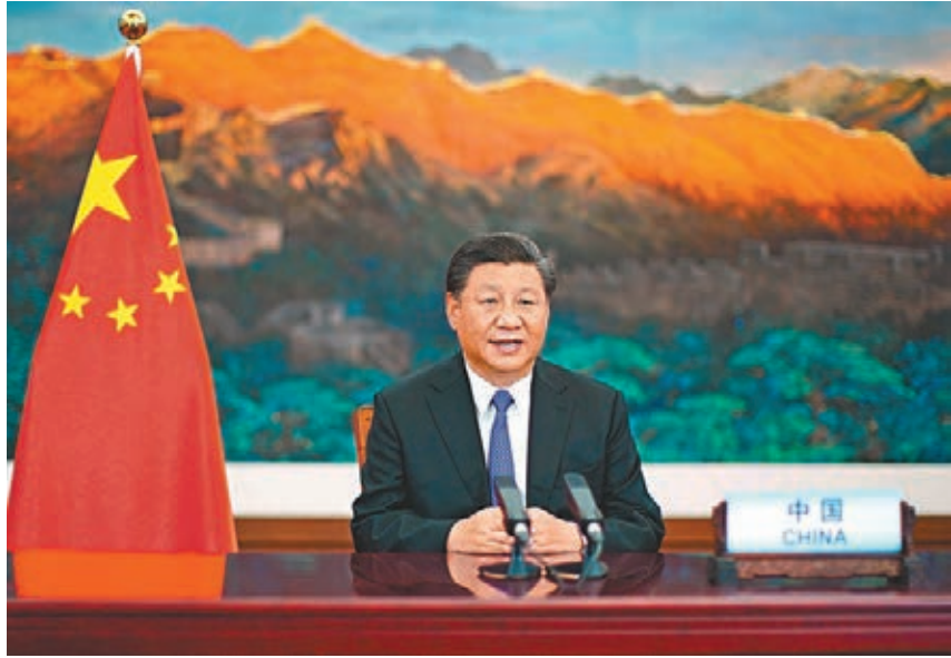
10月1日，習近平在聯合國大會紀念北京世界婦女大會25周年高級別會議上發表重要講話。

香港文匯報訊 據新華社報道，國家主席習近平1日在聯合國大會紀念北京世界婦女大會25周年高級別會議上通過視頻發表重要講話。習近平指出，婦女是人類文明的開創者、社會進步的推動者，在各行各業書寫着不平凡的成就。