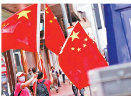
市民於銅鑼灣鬧市展示國旗。

香港文匯報訊(記者 子京) 香港同胞慶祝國慶籌委會昨日特別舉行巴士巡遊活動，安排四輛展示「慶國慶 賀中秋」橫額，及懸掛國旗、區旗的開篷巴士，沿新界及九龍各區巡遊，沿途播放《我和我的祖國》，與全港市民一同歡度佳節。 參與巡遊的巴士在昨日早上9點分別從啟田商場及大圍車公廟出發。其中九龍路線途經彩虹、黃大仙、九龍城、土瓜灣、何文田、油麻地、旺角各區，並以尖東為尾站。新界路線則途經大圍、沙田、大埔、葵涌、荃灣、屯門、天水圍，以元朗為尾站，活動歷時5小時。亦有市民租用紅色的敞篷大巴在港島巡遊，車上市民不斷揮動國旗，為祖國的大喜之日送上祝福，街上有行人揮手回應，共享喜悅之情。