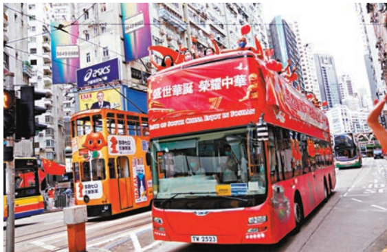
香港同胞慶祝國慶籌委會昨日特別舉行巴士巡遊活動。

香港文匯報訊(記者 子京) 香港同胞慶祝國慶籌委會昨日特別舉行巴士巡遊活動，安排四輛展示「慶國慶 賀中秋」橫額，及懸掛國旗、區旗的開篷巴士，沿新界及九龍各區巡遊，沿途播放《我和我的祖國》，與全港市民一同歡度佳節。 參與巡遊的巴士在昨日早上9點分別從啟田商場及大圍車公廟出發。其中九龍路線途經彩虹、黃大仙、九龍城、土瓜灣、何文田、油麻地、旺角各區，並以尖東為尾站。新界路線則途經大圍、沙田、大埔、葵涌、荃灣、屯門、天水圍，以元朗為尾站，活動歷時5小時。亦有市民租用紅色的敞篷大巴在港島巡遊，車上市民不斷揮動國旗，為祖國的大喜之日送上祝福，街上有行人揮手回應，共享喜悅之情。