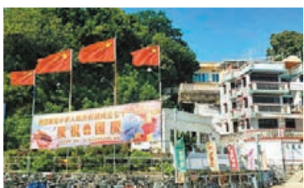
新界27鄉以各種形式營造節日氛圍。

香港文匯報訊(記者 子京) 新界27鄉紛紛以各種形式營造節日氛圍，雖然疫情關係不能舉辦一些群眾性慶祝活動，但他們鄉郊居民用最傳統的節慶方式表達他們的愛國熱情。據不完全統計，新界鄉郊區共做了20多個慶祝花牌，各有特色。各鄉事會同村公所機構建築上都換上了嶄新的國旗和區旗，有鄉事機構特別出心裁懸掛很多串旗，營造一片吉祥氣氛。