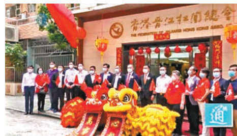
香港晉江社團總會以一場熱鬧的舞獅表演慶國慶、賀中秋。