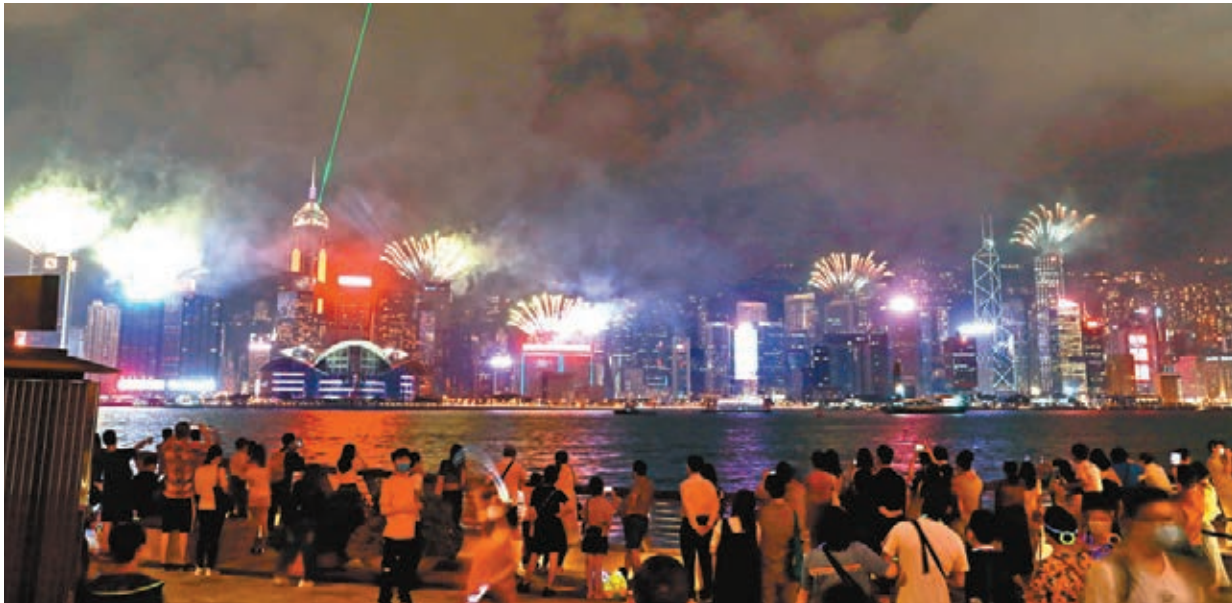
幻彩詠香江煙火激光匯演。