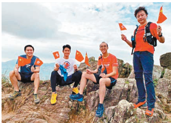
香港青年自發組織登上獅子山，唱國歌，揮舞國旗、區旗，慶祝國慶節。