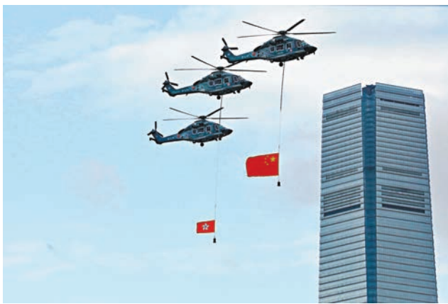
直升機掛着國旗、區旗在維港巡遊。