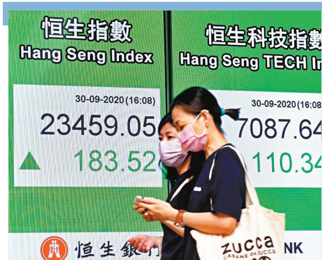
■ 港股第三季最後一個交易日雖上升，但首三季下瀉4,730點。

昨日是股市第三季最後一個交易日，恒生指數雖然全日升183點，但整個9月跌幅仍有6.8%或1,718點，第三季度則累跌968點。而2020年首三季，恒指跌幅更達4,730點或16.8%，相對滬指同期升5.5%、道指跌2.4%(見表)，港股明顯跑輸。展望第四季，市場人士並未抱太樂觀的態度，認為恒指將要考驗23,000點的支持力。