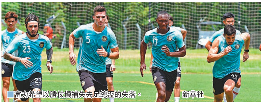
富力希望以勝仗填補失去足總盃的失落。