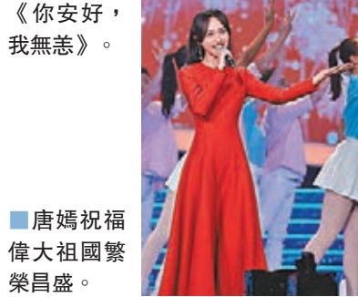
唐嫣祝福偉大祖國繁榮昌盛。

於昨晚2020年中秋、國慶雙節齊至之際，中央廣播電視總台文藝節目中心播出《中國夢·祖國頌——2020國慶特別節目》，一眾明星以精彩、深情的演出，帶領觀眾回憶了這特殊一年中所經歷的事件，於佳節安樂氣氛中，向一些人表達未來得及說出的感謝。