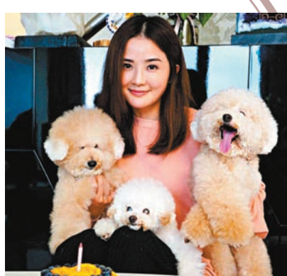
阿Sa花很大力氣才令一眾毛孩望鏡。

香港文匯報訊 (記者 梁靜儀) 蔡卓妍 (阿Sa) 近日忙於宣傳新片，但她都未有冷落家中的毛孩，前晚阿Sa趁中秋前，預備蛋糕為三隻年老愛犬「月餅」、「冰皮」、「碌柚」慶祝14歲大壽，並在社交網站分享了多張與貓狗的大合照，並留言：「月餅、冰皮、碌柚14歲大壽，14歲等 (於) 人類的69歲，#時光飛逝但願牠們健康康康#繼續衣食無憂#阿媽唔易做#要佢地全部望鏡超難。」由於毛孩愛走動，阿Sa幾經辛苦終於影到合照。