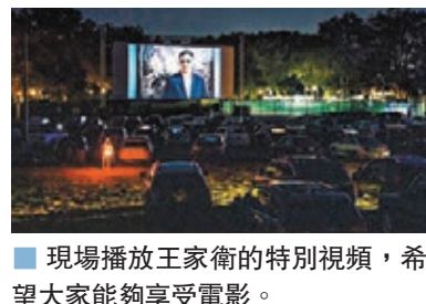
現場播放王家衛的特別視頻，希望大家能夠享受電影。

其中，張曼玉是迄今為止華語影壇獲獎最多的電影演員之一，無論是在商業還是文藝片領域都有不凡表現；林青霞在眾多影片尤其是武俠片中留下倩影，成就無數經典形象；惠英紅則以不言棄、勇攀巔峰的精神於近年重創影視巔峰。現年90多歲的田華，以及王曉棠、劉曉慶、鞏俐、章子怡等人，都是見證了中國影視起步、發展的影壇一代女神，她們的演出各有特色，代表着中國影視行業發展的不同階段。至於年齡最小的周冬雨，實力也有目共睹。