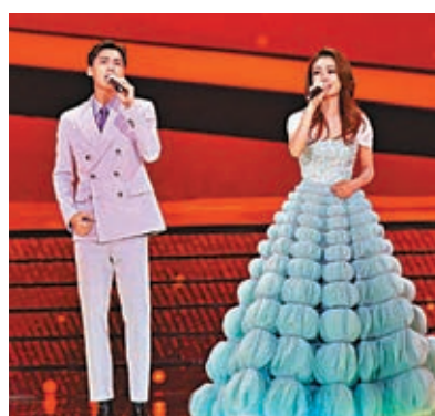
李易峰和容祖兒獻唱《你安好，我無恙》。