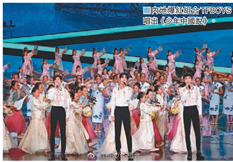
內地爆紅組合TFBOYS唱出《少年中國說》。