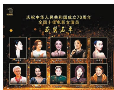
入選女演員們橫跨70年，代表着中國影視行業的傳承。

香港文匯報訊 (記者 依江、阿祖、達里) 新時代國際電影節組委會聯合第27屆華鼎獎組委會，近日在澳門發布了新中國成立70周年全國十佳電影女演員獲獎名單：張曼玉，鞏俐，林青霞，劉曉慶，章子怡，田華，王曉棠，周冬雨，惠英紅，祝希娟成功入選。十位女演員橫跨70年中的不同時代，她們的匯聚代表着中國影視行業的傳承。