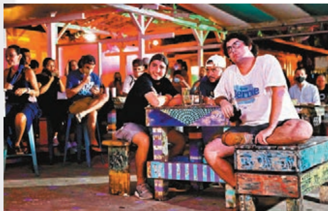
美國民眾觀看特朗普與拜登的辯論。