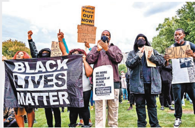
反種族歧視民眾同日示威。