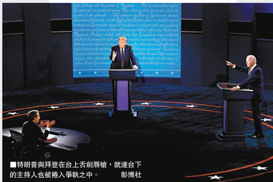
特朗普與拜登在台上舌劍唇槍，就連台下的主持人也被捲入爭執之中。

然而特朗普仍不罷休，不久後當拜登以已故長子博·拜登在伊拉克服役的經歷，批評特朗普形容陣亡軍人是「失敗者」的言論時，特朗普卻硬生生地將話題轉回亨特身上，「我不認識博，只認識亨特」，還錯誤聲稱亨特年輕參軍時因吸食可卡因被懲罰革職(亨特實際是「行政退伍」)，「他此後便沒有工作，直至你(拜登)出任副總統為止……他從烏克蘭、中國及俄羅斯等地獲利。」拜登承認亨特曾經濫藥，但已經戒毒。 ■綜合報道