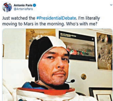
太空人帕里斯直言看完大選辯論後要移民火星。

美國首場總統候選人辯論，最終淪為兩名候選人特朗普和拜登互相指罵的鬧劇，使外界大感失望。美國哥倫比亞廣播公司(CBS)在辯論結束後的即時民調顯示，接近7成受訪者對辯論感到煩厭。美國傳媒亦禁不住齊聲狠批，直斥有如「一場爛騷」，形容「美國人民是輸家」。