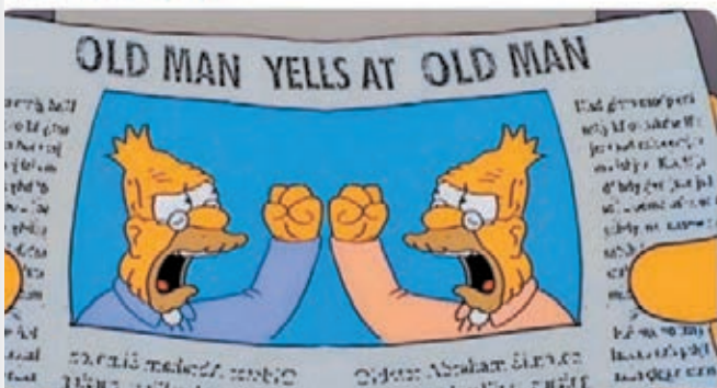
網友恥笑大選辯論是「阿伯互片」(上圖)及互相用槍指向對方(下圖)。