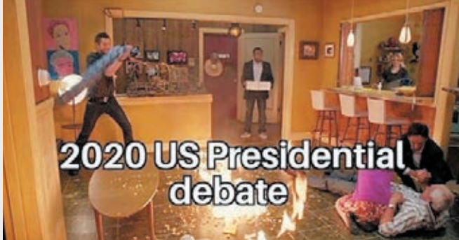
美國大選辯論一團糟，令全球大開眼界。