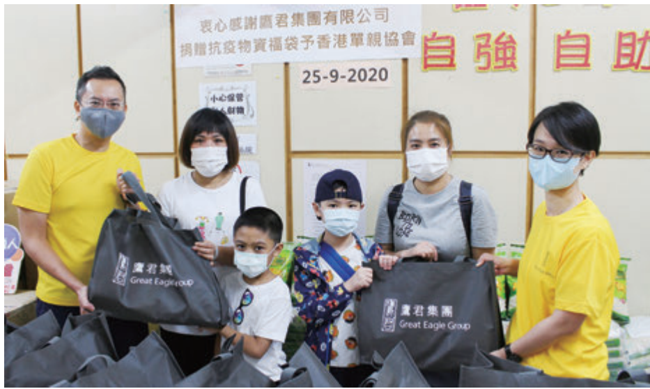
鷹君集團代表為有需要家庭送上愛心食物及防疫包，並了解他們在疫期間遇到的困難及壓力。

鷹君集團積極造福社會，支援弱勢社群。適逢中秋佳節，鷹君集團透過香港單親協會及浸信會愛羣社會服務處直接將愛心食品及防疫包送贈予有需要的單親家庭，以表關懷。