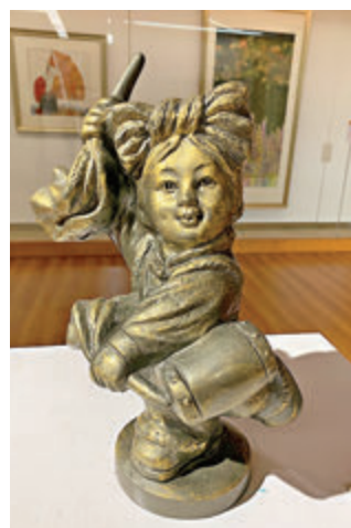
香港雕塑家朱達誠作品《歡慶》