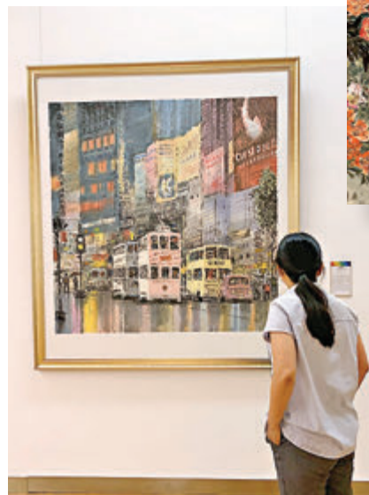
一位觀眾在香港畫家沈平的中國畫《雨夜銅鑼灣》前細細觀賞