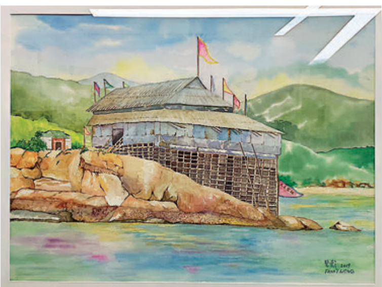
香港畫家王碧影水彩作品《香港蒲台島神功戲棚》