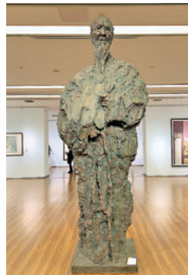
中國美術館館長、中國美協副主席吳為山雕塑作品《似與不似之魂》。