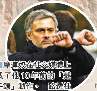
摩連奴在社交媒體上載了他10年前的「戴手錶」動作。

香港文匯報訊（記者 梁志達）熱刺剛於英超冤枉失分，又要趕緊在英格蘭聯賽盃16強主場迎撼車路士（香港時間3：45a.m.開賽）。