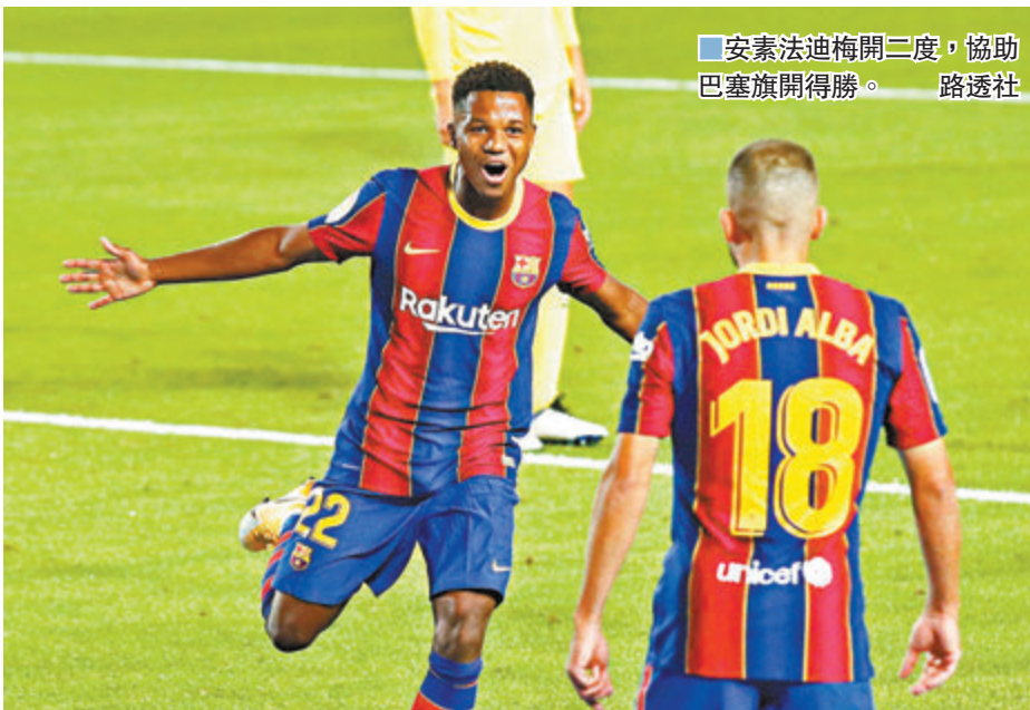
安素法迪梅開二度，協助巴塞旗開得勝。