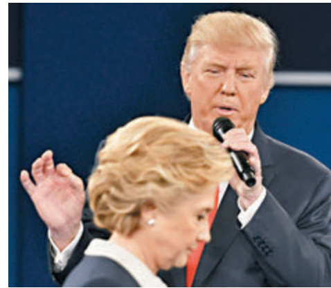
■希拉里憶述在上屆大選與特朗普辯論時，感到很不舒服。