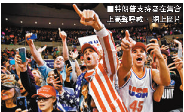
■特朗普支持者在集會上高聲呼喊。