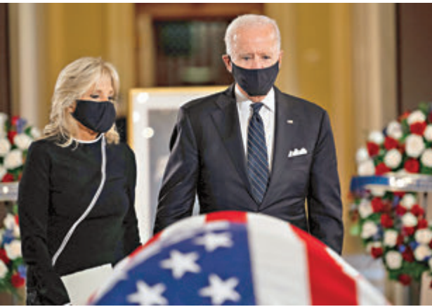
■拜登與妻子向已故大法官金斯伯格的遺體致哀。