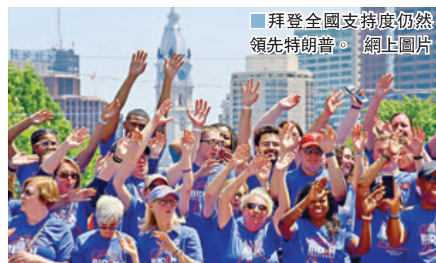
■拜登全國支持度仍然領先特朗普。