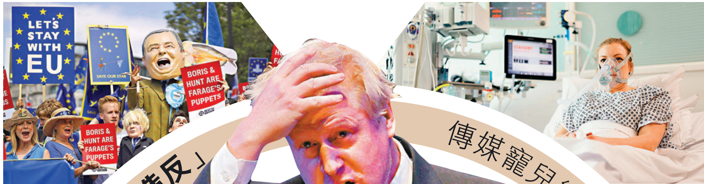
英國的脫歐爭議持續，在當地引發連串示威，令約翰遜備受壓力。 網上圖片