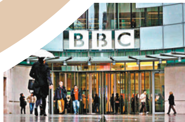
「外憂慮約翰遜試圖整頓BBC」 「外憂慮約翰遜試圖整頓BBC」