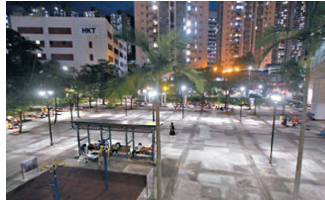
富家子遭設局在馬鞍山鞍祿街一公園內遇劫。

在連兩日(26日及27日)的打擊酒後及藥後駕駛行動中,警方一共要求786名司機接受酒精呼氣測試,當中12名(28歲至51歲)男女司機未能通過酒精呼氣測試,涉嫌「酒後駕駛」被捕。另外,一名57歲男司機則涉嫌「拒絕提供呼氣及血液樣本」被捕。各人已獲准保釋候查,須在10月下旬再向警方報到。