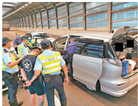
企圖倒車逃走的男司機被捕。

香港文匯報訊(記者 蕭景源)警方新界南總區交通執行及管制組特遣隊人員,前晚至昨日凌晨在區內執行大規模打擊酒後及藥後駕駛行動。其間在葵涌青沙公路近海麗邨,一輛電單車未依警員指示停車並衝向路障,以時速約200公里狂飆企圖逃走,惟在1.6公里外的志昂路企圖掉頭時,失控撞中一輛警車,當場車翻人仰受傷被制服,並被搜出毒品及揭發無牌駕駛、偷車等十宗罪被捕。此外警員在同一路障前亦成功制服多名私家車男司機,檢獲市值約5.5萬元霹靂可卡因。