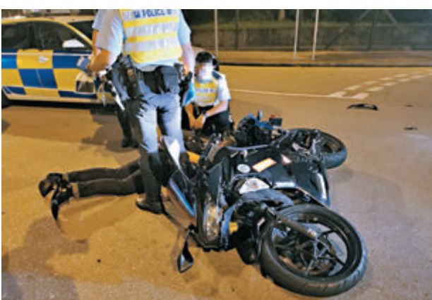
警方圖片 涉案鐵騎士輕傷被警員制服地上。

第一部毒藥」、「在藥物影響下駕駛」、「危險駕駛」、「沒有有效駕駛執照駕駛」、「駕駛時沒有有效第三者保險」、「使用虛假文書」、「駕駛未獲發牌車輛」、「擅自取去交通工具」及「盜竊」合共十宗罪將他被捕。