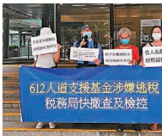
市民到稅務大樓請願，要求撤查「612基金」逃稅。

香港文匯報訊(記者 子道)攪炒派自去年成立所謂的「612人道支援基金」，一直以基金名義發起聚眾，至今總收入已逾億元，但其賬目卻從未