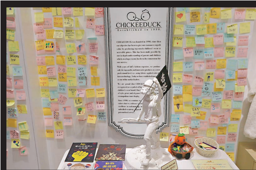
■K11 MUSEA 業主已向 Chickee Duck 發禁制令，要求搬走「黑暴女神像」擺設。香港文匯報記者攝