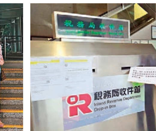
市民將投訴信放入稅局信箱。

香港文匯報訊(記者 子道)攪炒派自去年成立所謂的「612人道支援基金」，一直以基金名義發起聚眾，至今總收入已逾億元，但其賬目卻從未