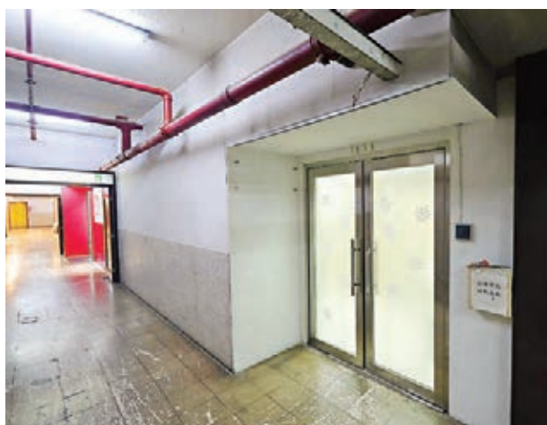
被投訴為「龍門冰室」的非法月餅工廠，昨拒絕記者入內採訪。