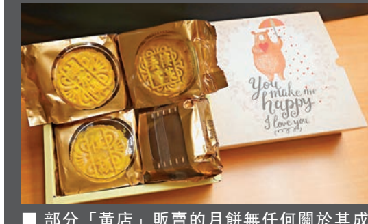
部分「黃店」販賣的月餅無任何關於其成分、食用日期的標籤。