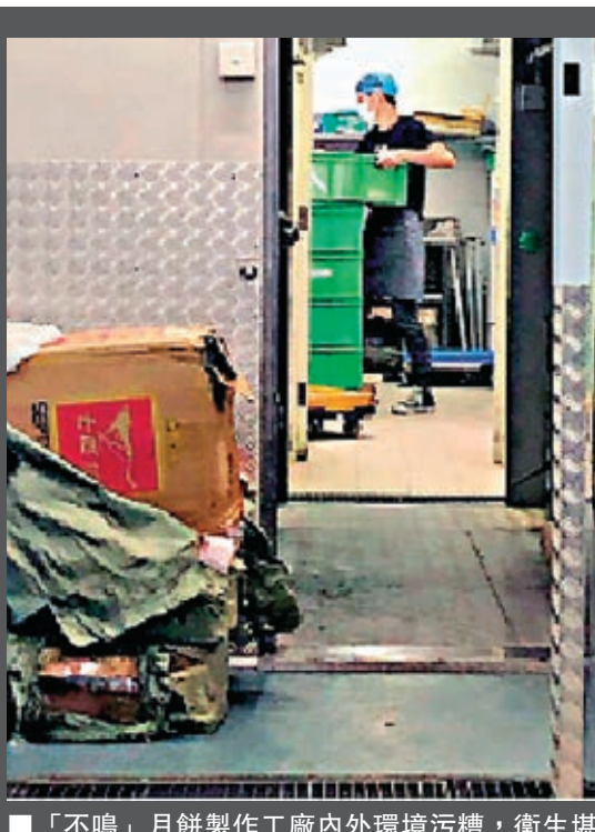
「不鳴」月餅製作工廠內外環境污糟，衛生堪憂。大公報圖片