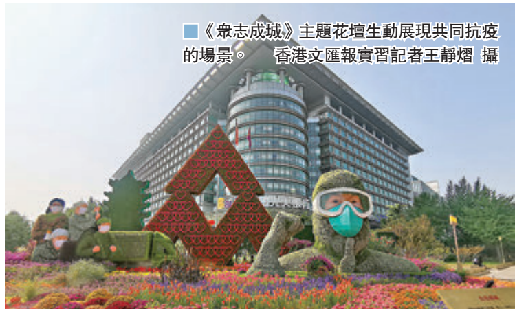
《眾志成城》主題花壇生動展現共同抗疫的場景。

香港文匯報訊（記者 張帥、實習記者 王靜嫻 北京報道）「十一」國慶節即將來臨，北京天安門廣場「祝福祖國」大花籃近日已亮相。大花籃以喜慶的花果籃為主景，花籃為鋼架結構，籃身為玻璃鋼材質，頂高達18米。香港文匯報記者注意到，在花籃籃內擺放有全國各省、自治區、直轄市、港澳台的代表花卉以及富有吉祥寓意的果實，香港紫荊花在其中格外醒目。