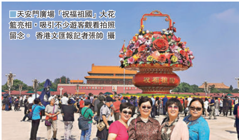
天安門廣場「祝福祖國」大花籃亮相，吸引不少遊客觀看拍照留念。