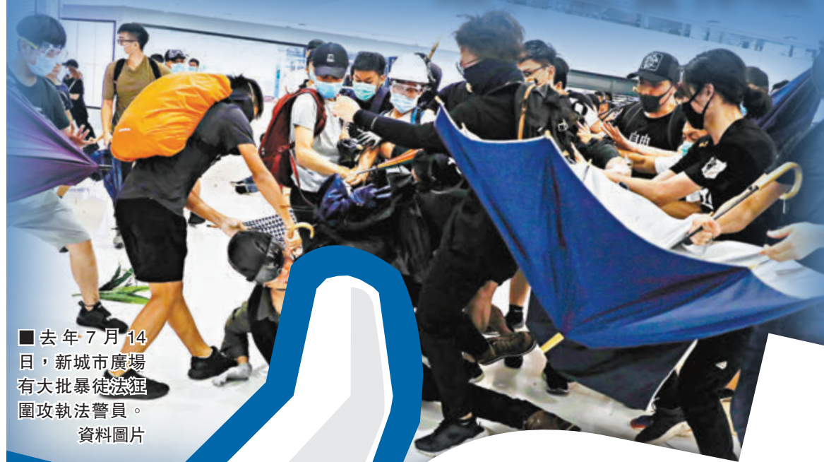
■去年7月14日，新城市廣場有大批暴徒法團圍攻執法警員。