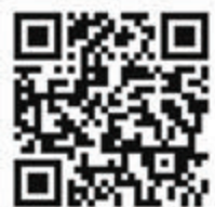
「正向家長運動」宣傳片。

教育局指，首輯短片及相關電台宣傳聲帶會於今日首播，其餘宣傳短片亦將陸續推出，相關資訊可瀏覽www.parent.ed.gov/article/ap1。