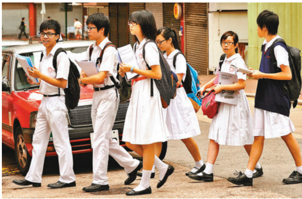
45間學校獲批本學年起加學費。

提供IB國際文憑課程的李寶椿聯合世界書院，學費加約4%至102,000元，而該校宿費