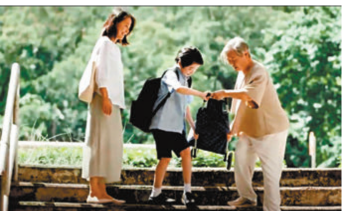
家長教導子女多關心身邊的人。

每一輯「正向家長運動」短片均引用了早前的家長教育標語創作比賽優勝作品作主體內容及結語，由動畫故事轉接至真人實境拍攝，期望透過改編故事及家庭日常點滴，引起家長及小朋友的共鳴。第一輯短片以「關懷鼓勵與接納，正向家庭齊建