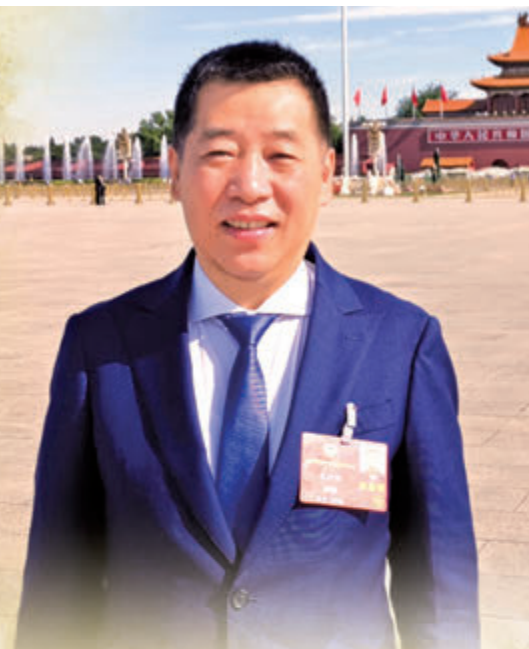
全國政協委員、山東省政協常委、香港山東各級政協委員聯誼總會會長朱新勝

全國政協委員、山東省政協常委、香港山東各級政協委員聯誼總會會長朱新勝，多年來履職盡責，堅定不移地貫徹「一國兩制」方針和基本法，以愛國愛港為己任，團結凝聚廣大愛國愛港人士，維護法治，以實際行動支持香港特區政府依法施政，保穩定、謀發展，緊扣香港與祖國內地共同發展的使命，為內地與香港經濟社會發展貢獻力量。