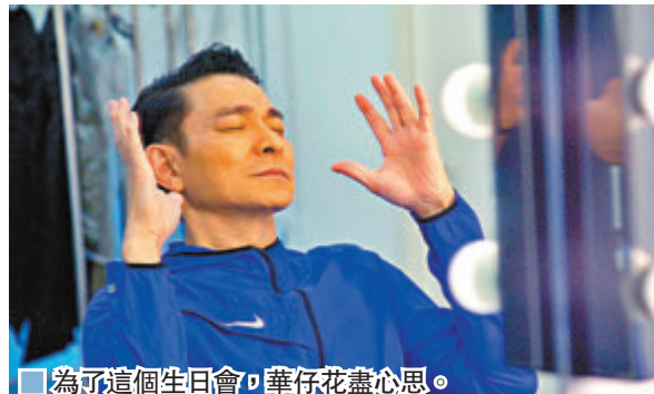
為可這個生日會，華仔花盡心思。