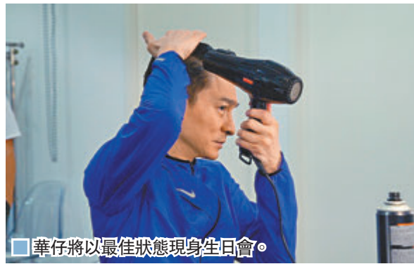
華仔將以最佳狀態現身生日會。