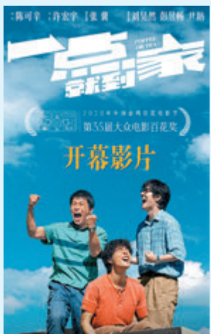
《一點就到家》今日與觀眾見面。