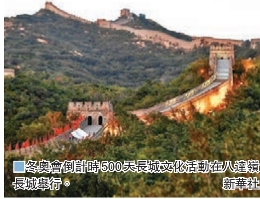
冬奧會倒計時500天長城文化活動在八達嶺長城舉行。新華社

整場活動由《冬奧有我》《冰雪情懷》等冬奧優秀歌曲串聯。璀璨燈光映照的長城上，英姿颯爽的旗手們奔跑着將北京冬奧會會旗向高處傳遞，表達對北京冬奧會的祝福和期盼。 ■中新社