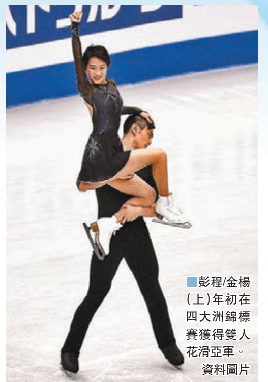
彭程/金楊(上)年初在四大洲錦標賽獲得雙人花滑亞軍。資料圖片