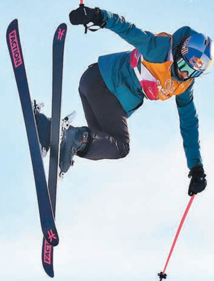
年僅17歲的谷愛凌年初在世界盃U型地場賽連奪金。