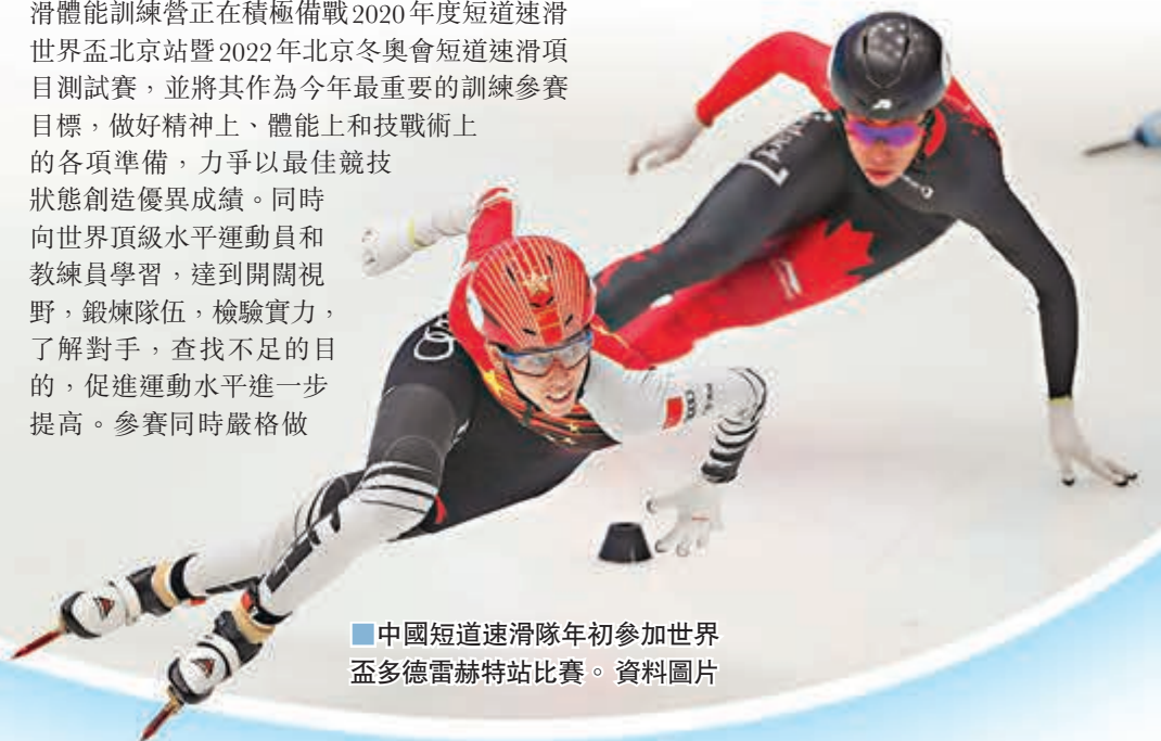
中國短道速滑隊年初參加世界盃多德雷赫特站比賽。