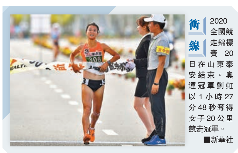
2020全國競走錦標賽20日在山東泰安結束。奧運冠軍劉虹以1小時27分48秒奪得女子20公里競走冠軍。

鹽池縣是紅軍西征在寧夏建立的第一個縣級政權，也是寧夏唯一經歷過土地革命、抗日戰爭、解放戰爭三個歷史時期的革命老區。選擇這裏作為活動地點，也體現了「薪火傳承·中國健康跑」系列賽事活動對中國紅色文化的追憶和傳承！