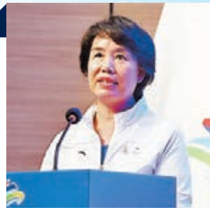
北京冬奧組委專職副主席、秘書長韓子榮。資料圖片

韓子榮表示：「未來500天，面對新形勢新挑戰，我們將進一步加強與國際奧委會、國際殘奧委會、國際冬季單項體育聯合會等方面的溝通合作，及時研判形勢，及時調整策略，加強工作創新，妥善應對風險挑戰，讓籌辦工作朝着既定目標穩步有序向前推進。」 ■新華社