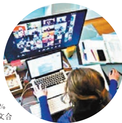
甲骨文今年早前與Zoom開展合作。

根據市場研究公司Gartner去年發表報告，亞馬遜、Google、微軟3間甲骨文的最大對手，雲端服務收入都較甲骨文高；戴維斯認為TikTok日後將漸漸棄用Google的雲端，以助甲骨文發展。 ■綜合報道