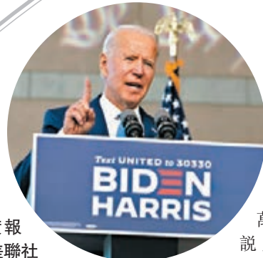
拜登再度報錯數。

美國新冠疫情死亡人數逼近20萬，民主黨總統候選人拜登前日在競選活動上，談及新冠死亡人數時，卻錯誤把「20萬」(two hundred thousand)說成「2億」(two hundred million)，相當於接近2/3美國人口死亡，遭保守派傳媒引為笑柄。