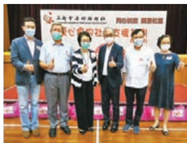
工聯會康齡服務社舉辦「愛心食物社區支援計劃」啟動禮。

「愛心食物社區支援計劃(2020年)」將分階段向長者及失業工友合共派發一萬個「愛心食物包」，配合義工電話訪問及家訪向有需要人士送上物資和關懷。首批3,000個「愛心食物包」內有工聯會工人醫療所湯包、香米、米粉、燕麥片、午餐肉、餅乾及工聯會口罩，更附有心意卡和「抗疫小冊子」，將盡快送到有需要人士手中。工聯會榮譽會長陳婉嫻對贊助商