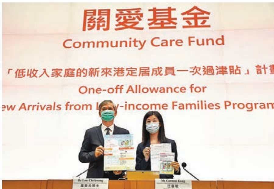
勞工及福利局局長、關愛基金專責小組主席羅致光(左)及關愛基金專責小組秘書江嘉敏公布派錢計劃詳情。

羅致光認為，今次計劃的行政費合理，更比俗稱「N無」的「非公屋、非綜援的低收入住戶一次過生活津貼」計劃的每宗成功個案行政費250元為低，原因是「N無」計劃的審核過程較為繁複。