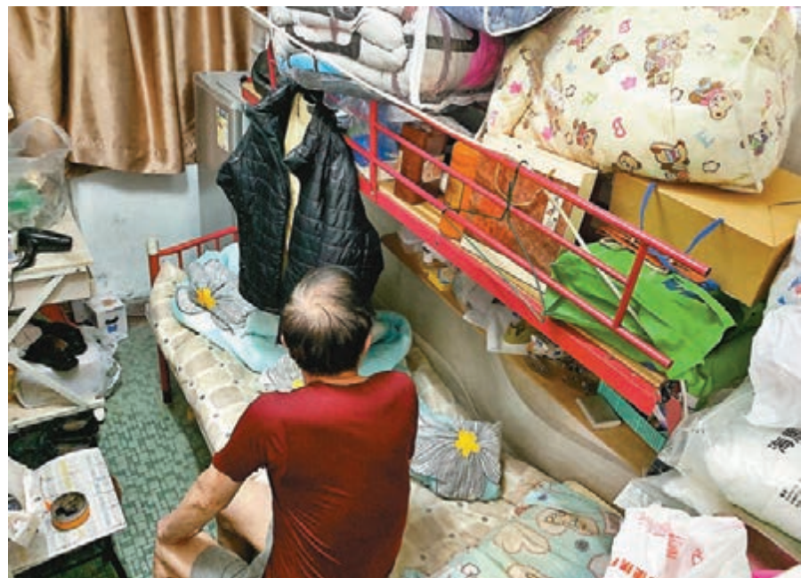
關愛基金為協助低收入的新來港人士渡過抗疫難關，周日起分三階段接受申請一次性1萬元津貼。圖為香港低收入戶居住環境。