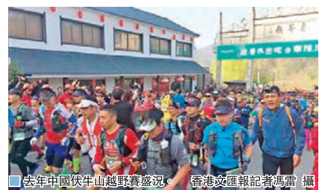
■去年中國伏牛山越野賽盛況。

MaXi-Race系列越野賽起源於歐洲阿爾卑斯山脈,享有「阿爾卑斯陽台」美譽的法國濱湖小鎮安納西,現已發展成為具有全球影響力、歐洲最負盛名的越野跑賽事之一,先後在意大利、南非、厄瓜多爾等地舉辦系列賽。