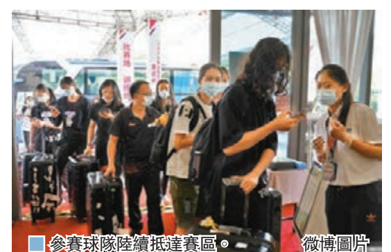
■參賽球隊陸續抵達賽區。

香港文匯報訊(記者 陳曉莉)2020年全國女排錦標賽將於9月23日至10月2日在廣東江門全封閉舉行。受新冠肺炎疫情影響,自2019-2020賽季排超聯賽結束後,內地已有7個多月未曾舉辦女排賽事,本屆全錦賽將是女排隊將在新賽季的首秀。根據2019年賽事名次,13支參賽隊分為A、B兩組,A組7隊是上海、天津、江蘇、北京、福建、雲南和湖北,B組6隊是山東、遼寧、浙江、廣東、河南和四川。小組前4名在第二階段進行交叉淘汰賽,決出冠軍誰屬。