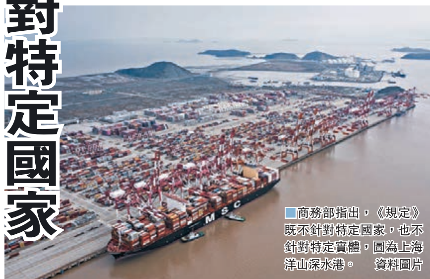
商務部指出，《規定》既不針對特定國家，也不針對特定實體，圖為上海洋山深水港。

對於不可靠實體清單是否「只進不出」的疑問，該負責人回應稱，工作機制將按照《規定》，對不可靠實體清單實施動態管理。移出清單的決定可以由工作機制依職權作出，相關外國實體也有權向工作機制申請將其從清單中移出。在將有關外國實體列入清單的公告所明確的改正期限內，如該實體改正其行為並採取措施消除行為後果的，工作機制應當作出決定，將其移出清單。此外，清單沒有預設時間表和企業名單，工作機制在綜合考慮各項因素作出決定後，將依法予以公告。