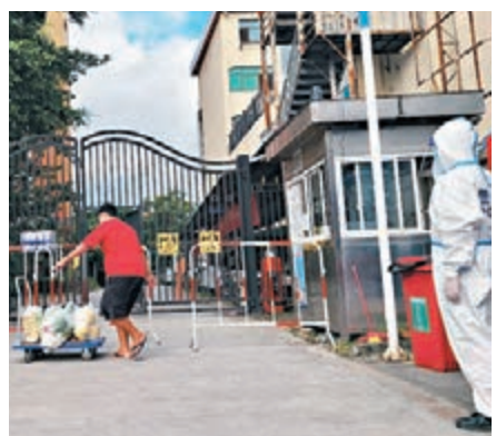
雲南要求各地全面進入「戰時」狀態，圖為該市封閉管理中一個小區，居民取走超市送來的食物。

截至9月19日上午10時30分，所有287,254份樣本檢測完畢，檢測結果均為陰性；至下午7時，已反饋核酸檢測結果270,981人，其中通過健康碼反饋170,045人，通過電話、短信反饋100,936人，實現了核酸檢測採樣全面清零「不落一戶、不漏一人」的既定目標。