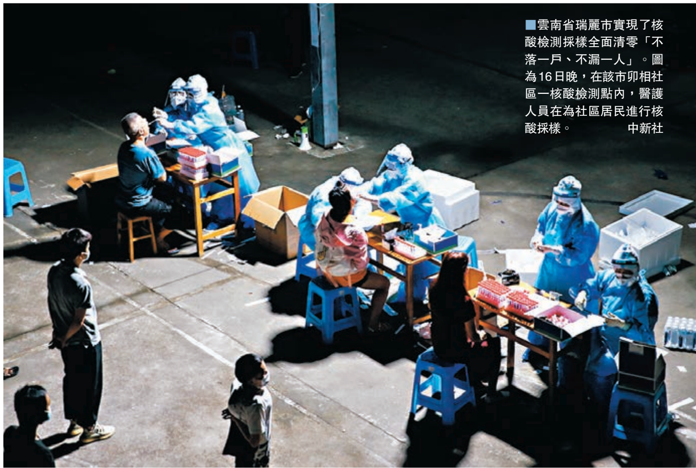
雲南省瑞麗市實現了核酸檢測採樣全面清零「不落一戶、不漏一人」。圖為16日晚，在該市卯相社區一核酸檢測點內，醫護人員在為社區居民進行核酸採樣。