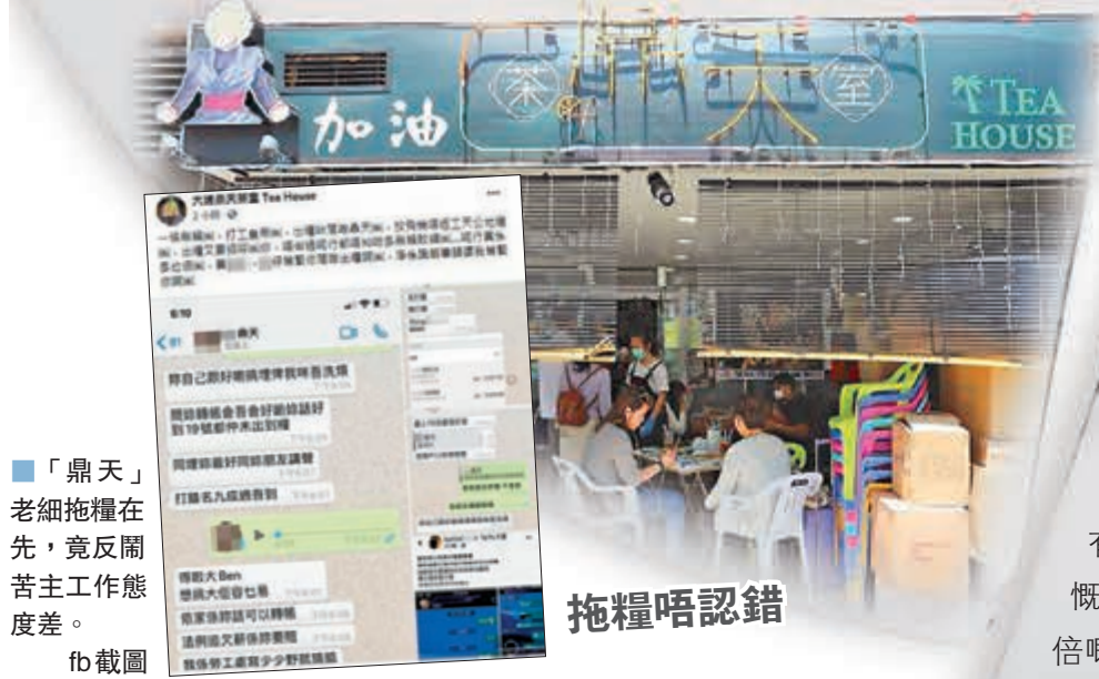
鼎天老細拖糧在先，竟反鬧苦主工作態度差。