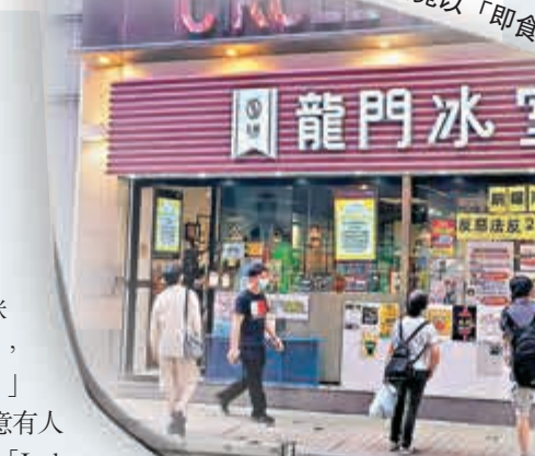
「龍門」難食無下限，今次竟以「即食湯包」(圖圖)奉客。

為咗投「黃絲」所好，唔少「黃店」都聲稱自己出售嘅產品唔係由內地生產。不過，有一間網上生果店就俾人踢爆以內地產生果充日本貨。最好笑係，《蘋果日報》為咗護短，竟將焦點轉移話有內地嘅生果係「假冒日本貨」，講到個「黃店」店主好無辜咁。有網民就留言直指：「一句講晒(晒)，你擺明呢人！咁大間舖呢人預左(咗)承擔責任！」