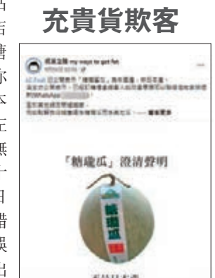
「成波之路」得悉被擺上枱後，即時與「LC Fruit」畫清界線。

《蘋果》報這呢單新聞時，引用「LC Fruit」負責人Dennis接受該報訪問時聲言自己因經驗不足，看糖龍瓜的包裝就「誤以為是日本貨」，並對「沒有清楚考究產地而深感抱歉」，之後就將焦點轉移去所謂「中國貨冒充日本貨」嘅話點上去，話有其他生果商都「中過招」，試圖