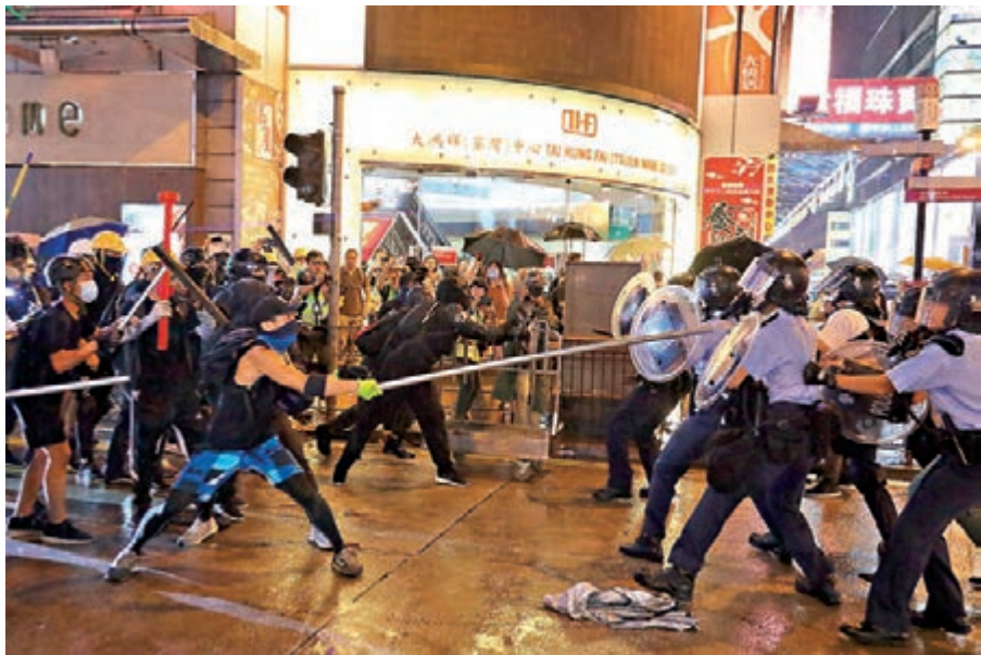
多起黑暴案件的量刑近日備受爭議，法律界倡議設立監察司法及量刑委員會。

他續說，本港法院對某些黑暴案件的判決及量刑過輕，故政府及司法機構須審慎看待，提出必要的司法改革措施，以挽回公眾對本港司法制度的信心。