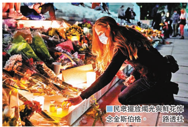
民眾擺放燭光與鮮花悼念金斯伯格。