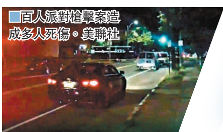
百人派對槍擊案造成多人死傷。