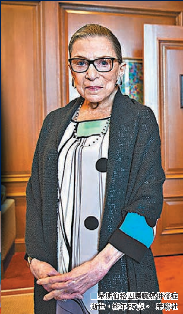
金斯伯格1993年在克林頓等人見證下宣誓，成為大法官。

美國最高法院公布，大法官金斯伯格因胰臟癌併發症，前日於華盛頓的寓所逝世，終年87歲。金斯伯格是最高法院4名自由派法官之一，外界關注總統特朗普或會在11月大選前，聯同控制參議院的共和黨，推舉保守派法官取代金斯伯格的位置，進一步壯大最高法院內的保守派勢力，同時可藉此取悅保守派選民，勢令大選增添變數。