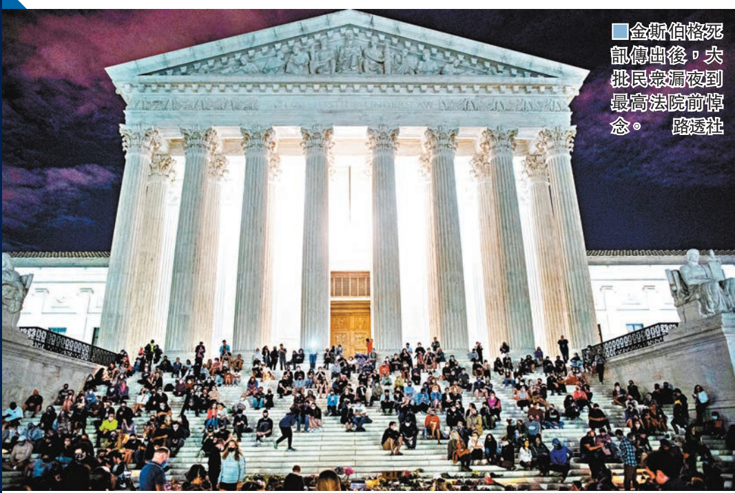
金斯伯格死訊傳出後，大批民眾湧到最高法院前悼念。