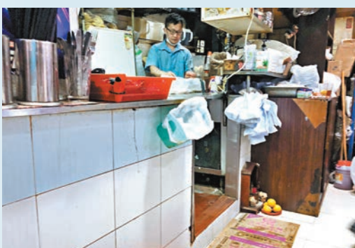
部分食肆亦「偷雞」違反政府防疫規定。圖為食肆員工沒有佩戴口罩。