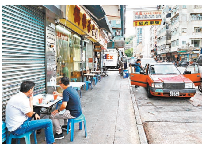
的士商會表示估計司機參與恒常檢測的比例不高。資料圖片