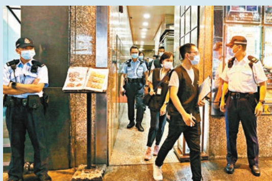
警方聯同民政事務處職員在尖沙咀金馬倫道一帶巡查樓上酒吧。

香港文匯報訊(記者 美釵)不少市民在政府放寬部分防疫措施後開始「報復式消費」，部分食肆亦「來者不拒」，「偷雞」違反政府防疫規定。為此，食環署及警方加強巡查，食衛局局長陳肇始昨日接受電台訪問時表示，有關部門過去數天已巡查食肆逾6,000次，暫已有66宗檢控。