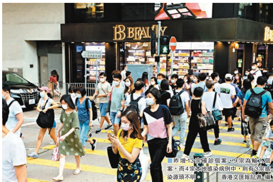
昨增13宗確診個案，9宗為輸入個案，而4宗本地感染病例中，則有3宗感染源頭不明。