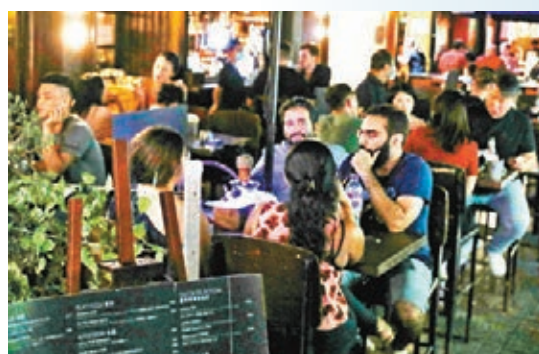
不少市民在政府放寬部分防疫措施後開始「報復式消費」。香港文匯報記者 攝