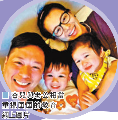
▲杏兒與老公相當重視囡囡的教育。