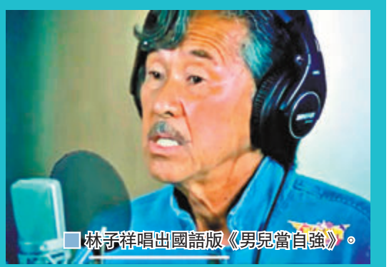
▲林子祥唱出國語版《男兒當自強》。

香港文匯報訊（記者阿祖）殿堂級歌手林子祥（阿Lam）代表香港於9月10日在全球直播的《風雨無阻——彩色世界線上演唱會》演出，阿Lam太太葉倩文於前晚分享老公演出的片段。接近15分鐘的演出片段中，阿Lam打頭陣唱出國語版《男兒當自強》，盡顯其澎湃浩蕩的唱功，緊接以輕柔感情唱出《分鐘需要你》中、英文版，阿Lam也感觸地說：「太糟糕了，這次大流行（新冠肺炎），大家都身在其中，我都不能見你，但是這在工作室裏挺好，給你錄點東西，都是一樣的！」之後再獨唱了《數字人生》後，阿Lam與兒子林德信及糖妹，一起唱出《三人行》英語版《The Unicorn Song》，三人唱歌時不時互望對笑，盡顯默契，亦為線上演唱會香港部分畫上圓滿句號。