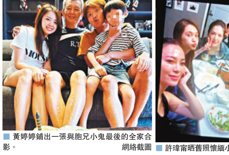
黃婷婷鋪出一張與胞兄小鬼最後的全家合影。