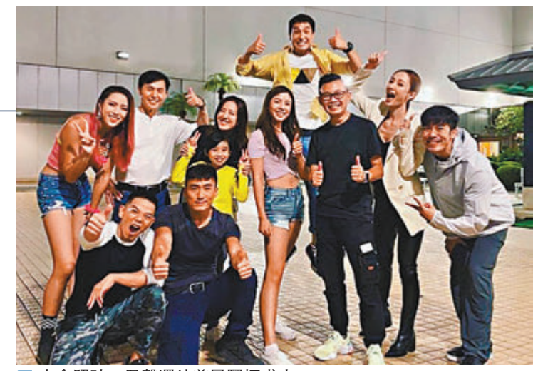
大合照時，君馨還站着風騷擺甫士。