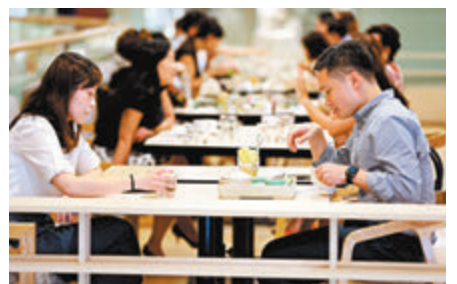
本港昨日新增3宗新冠病毒確診個案，當中兩宗為本地感染。

衛生防護中心昨日公布本港新增的確診個案，除兩宗為本地感染外，另一宗為輸入個案，為英國抵港的51歲女子，她9月6日已發病。本港昨日並沒有源頭不明個案，連同新增的3宗個案，本港累計已有4,996