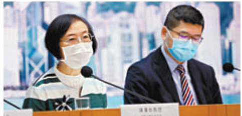
陳肇始在記者會上公布第四波疫情防疫策略。

現有亞博館社區治療設施可提供約900張病床，本港正透過中央政府的支援，擴展亞博館社區治療設施，爭取數周內額外配置約