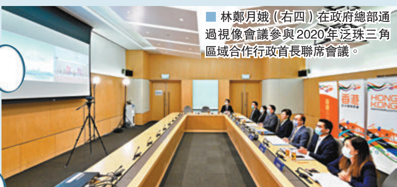
林鄭月娥（右四）在政府總部通過視像會議參與2020年泛珠三角區域合作行政首長聯席會議。

是次聯席會議在海南省三亞市召開。為處理本港疫情防控工作，林鄭月娥與香港特區政府相關官員留港以視像會議形式參與聯席會議。 會上，林鄭月娥與泛珠省區行政首長就疫後時代攜手推動泛珠區域合作高質量發展、建設現代化交通運輸網絡，以及共建成度集成創新平台等議題進行討論。 林鄭月娥表示，特區政府一直積極加強