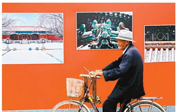
■一位農村大爺騎着單車從展覽照片前經過。

村裏的老人激動地說：「一輩子沒去過北京，沒想到在自己家門口就可以逛一回故宮，還能在金鑾殿前拍個照！」