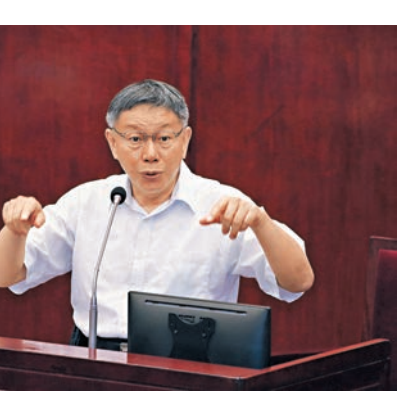
■台北市長柯文哲被問及有沒有想過角逐2024年台灣領導人選舉，他回應：「我不是想，我是直接準備。」 中央社

柯文哲表示，對於2022年縣市長選舉，他現在沒有時間部署，選舉大部分是選前半年，人選才會浮上檯面，這段時間就是順其自然。柯說，他也在思考，民眾黨要縮小自己，要挑最好的人才出來，不一定要民眾黨。