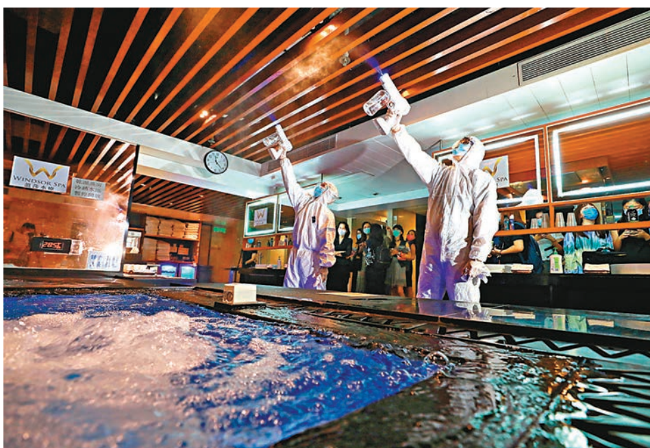
消毒團隊進行紫外線霧化消毒程序。

同時，水療池會每日換水，每隔3個小時消毒一次，淋浴間會「梅花間竹」地使用。中心亦會放置口罩、消毒搓手液供客人使用，客人入場前需要填寫健康申報表及測量