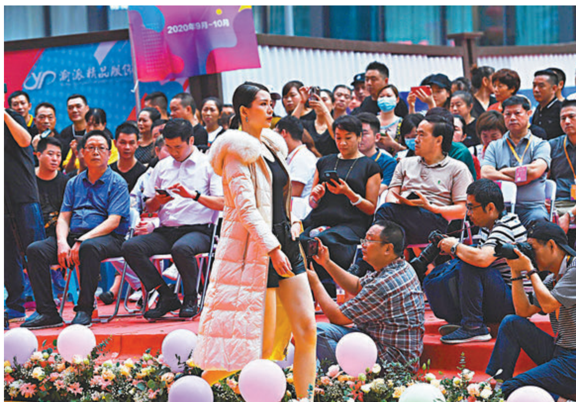
8月，內地社會消費品零售總額增速實現年內首次正增長，同比增長0.5%，較7月提高1.6個百分點。拉動消費的最主要因素仍是汽車消費，線下、服務性消費也繼續改善。圖為重慶朝天門一商場舉辦秋季消費採購節，並推動中秋、國慶「雙節」消費。

市場普遍預期，三季度內地經濟增速回升到5%-6%，二季度為3.2%。宏觀政策上，專家預計，宏觀調控處於觀望模式，收回已出的寬鬆刺激措施為時尚早，但下半年繼續加碼的可能性也較低，今年底可能不會有全面降準降息。